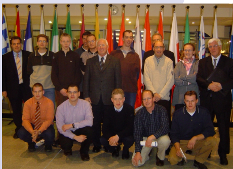
* SGP-Jongeren op excursie Europees Parlement Brussel

Ook de SGP- jongeren in Goedereede mag een groei in ledental onder de jongeren herkennen. Als studieverenging behandelen we een aantal keer per jaar praktische onderwerpen. Vaak wordt er een spreker uitgenodigd die weet in te gaan op vragen die onder ons als jongeren leven. Voor D.V. zaterdag 18 februari staat er een jongerendebatavond gepland. Op deze avond hopen alle politieke partijen vertegenwoordigd te zijn. Eerst zullen de fractievoorzitters aan de hand van stellingen met elkaar van gedachten wisselen. Verder wordt er veel ruimte geboden om als jongeren, politiek geïnteresseerd of juist helemaal niet, met de fractievoorzitters van gedachten te wisselen. Voor jongeren is het deze avond de kans om op een vrijblijvende manier kennis te maken met de politiek.