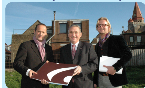
* Overhandiging van het schetsplan project: Dorpstienden

Uit het project Goekoop bleek dat er nog een dringende behoefte aan starterwoningen is. Op 1 december heeft projectontwikkelaar Blijvend Goed een schetsplan aan mij aangeboden voor bouwplannen rondom Dorpstienden.