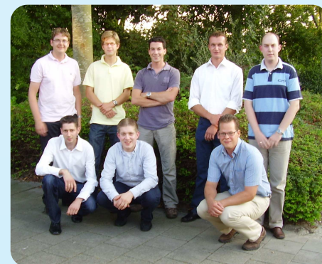
* SGP jongeren bestuur in 2009

Tien verkiezingspunten bewijzen dat de SGP-jongeren een eigen mening hebben over politiek in eigen gemeente. Voor jongeren kunnen weer andere zaken belangrijk zijn dan voor ouderen. Binnen de fractie van de SGP is ruimte voor deze inbreng. De SGP-jongeren hebben dan ook als speerpunt voor de verkiezingen aangedragen dat er voldoende starterwoningen gebouwd moeten worden. Iedere jongere die in de gemeente Goedereede wil blijven wonen, moet dat ook kunnen. Verder zijn de jongeren van mening dat de gemeente Goedereede zelfstandig moet blijven.